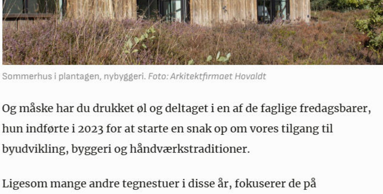
Sommerhus i plantagen, nybyggeri. Foto: Arkitektfirmaet Hovaldt

De Maritime Huse i Løkken, Hirtshals Lægehus, Himmerland Multihal i Farsø, lejlighederne Oasen i Hjørring og helt aktuelt: renovering af administrationsbygningen på Spritten i Aalborg, for at nævne nogle.