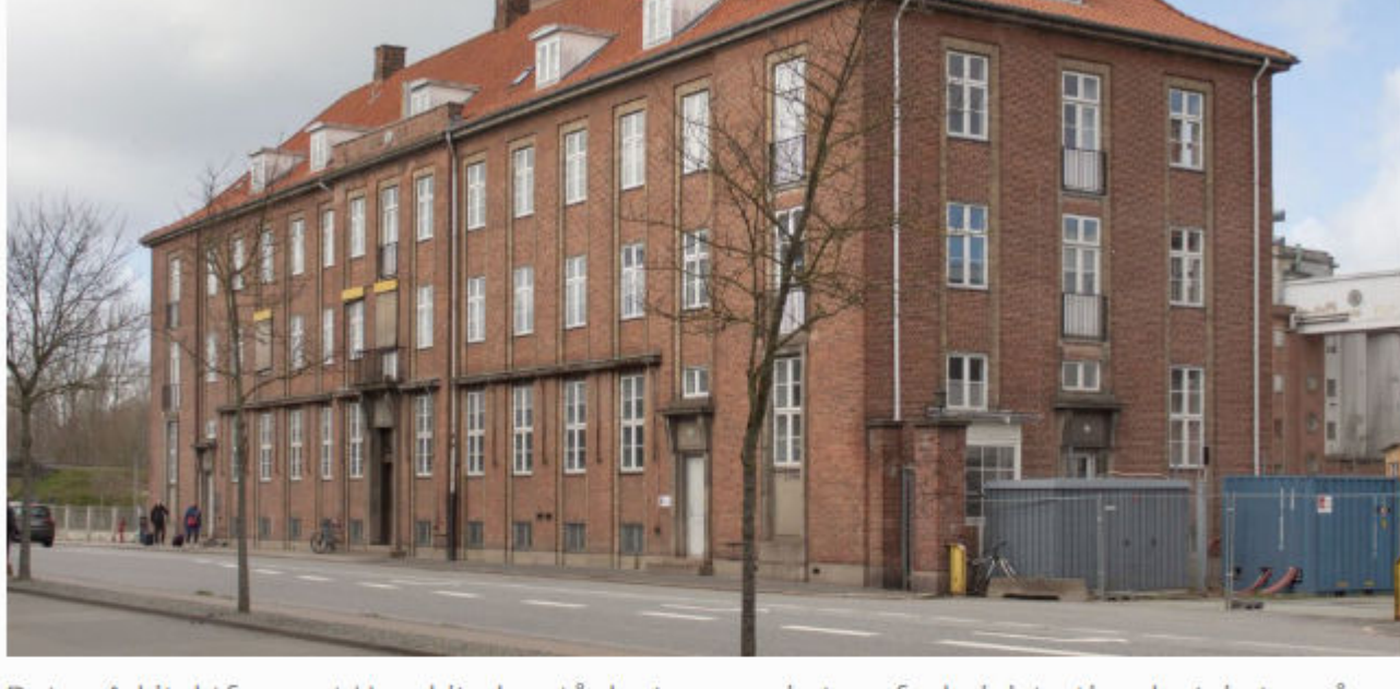
Det er Arkitektfirmaet Hovaldt, der står bag renoveringen af administrationsbygningen på den gamle spritgrund i Aalborg.

– Der er en rigtig stor barriere i bygningsreglementet, der er under revidering. Som den er i dag, er det svært at opfylde kravene i forhold til fx indeklima, tilgængelighed og dokumentation, hvis man ønsker at transformere eksisterende byggeri til nye funktioner.