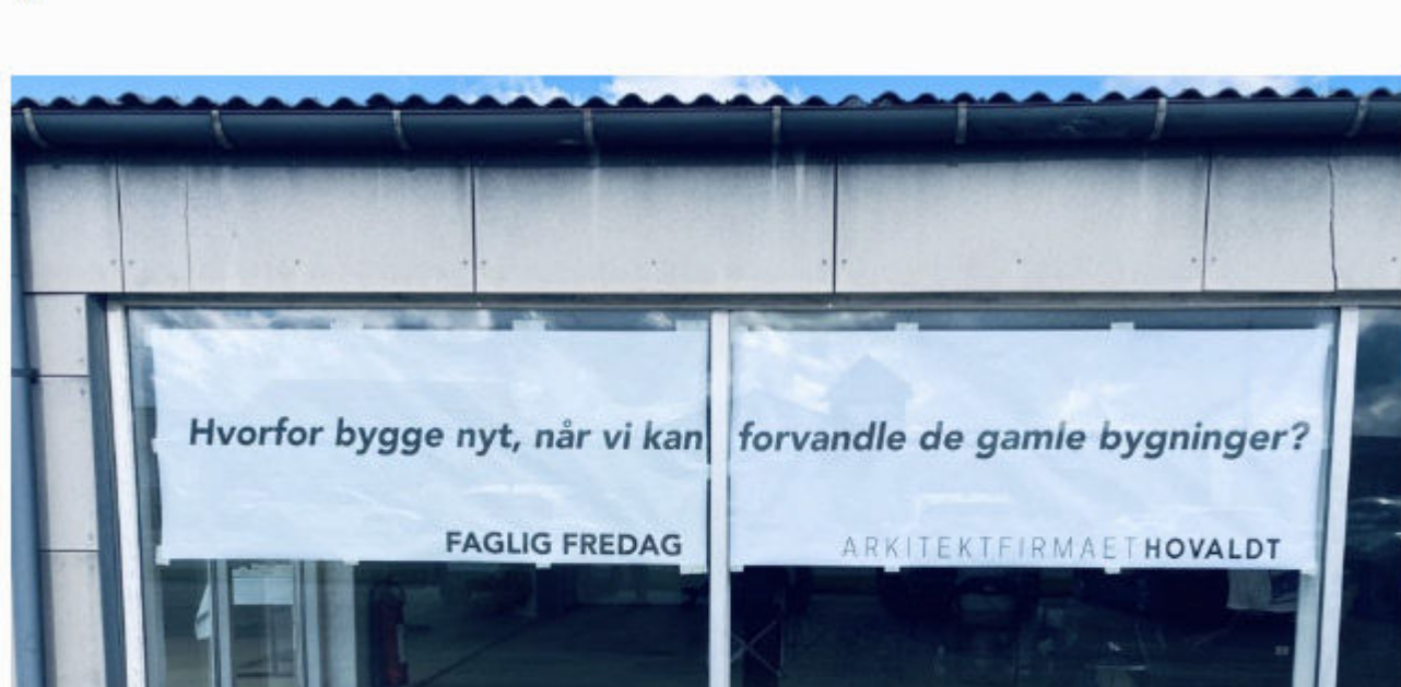
Faglig fredag om potentialet for at omdanne tomme erhvervsbygninger og butikker. Afholdt i et tomt erhvervslokale i Hjørring.

– Og vi vil rigtig gerne, at der kommer alle mulige forskellige mennesker. Vi har fx holdt en faglig fredag i samarbejde med håndværkerakademiet EUC i Hjørring, hvor vi talte om gamle stolte håndværkstraditioner. Vi vil gerne bidrage til at mindske afstanden mellem de udførende og rådgiverne, således alle kompetencer kommer i spil.